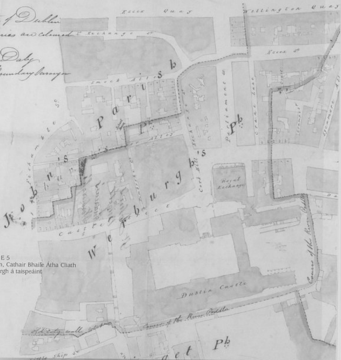
Suirbhéireacht Ordnáis - OS 36 E 5 Mapa de Shuirbhéireacht Teorann, Cathair Bhaile Átha Cliath Cuid de pharóiste Naomh Werburgh á taispeáint Lúnasa 1837

County of the City of Dublin The Parish Boundaries are shown & Exchange of from Aug t 6 th 1837. P. Dady Boundary Surveyor