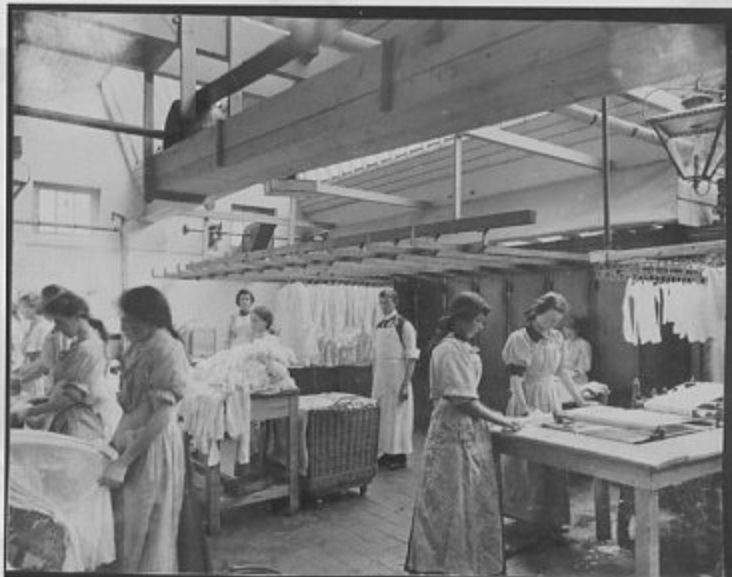
An 13ú Tuarascáil Bhliantúil ón gComhairle um an gCartlann Náisiúnta, 2004