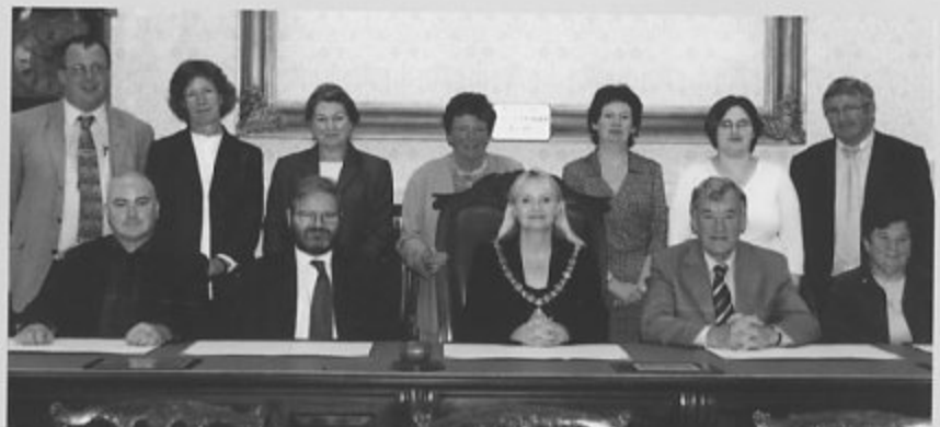
An 13ú Tuarascáil Bhliantúil ón gComhairle um an gCartlann Náisiúnta, 2004